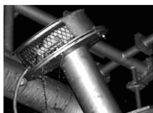
图1 压力释放阀漏油情况

(2)2003年,郑州站白郑线电抗器A相运行中压力释放阀突然出现严重漏油,见图1,电抗器被迫停运。检查认为主要原因是电抗器振动过大使压力释放阀中弹簧发生共振,造成释放阀关闭不严形成漏油。随后进行如下处理:油箱焊加强铁,改善本体振动情况;对铁心柱用液压装置重新压紧,见图2;更换了新型压力释放阀。处理后再次投运,运行至今基本正常。