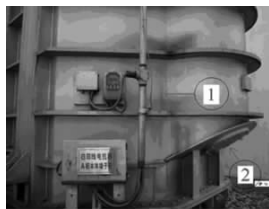
图5 振动超标测点位置图(1)