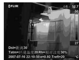
图8 A相红外测温图(C相和A相近似)

将图7、8进行对比,可以看出B相油箱上部温度明显偏高,并且本体油温在某一高度位置有明显突变(中间发黑的矩形位置为油箱外部设备铭牌),而A相本体油温从上到下过渡自然,符合油冷却的热传导特点。