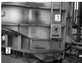
图6 振动超标测点位置图(2)

图4~6中,A相测点1振幅为130 μm,其余各点振幅均小于60 μm;B相测点1振幅为120 μm,测点3振幅为170 μm,其余各点振幅均小于60 μm;C相测点1振幅为118 μm,测点2振幅为119 μm,测点3振幅为117 μm,其余各点振幅均小于50 μm。