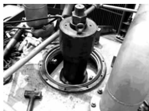
图2 电抗器上部进行铁心压紧

(3)2005年,南阳白河站500 kV樊白回线高抗A相运行中发生事故,高压套管炸裂倒地起火,套管下节升高座被推出5 m左右,高压引线断裂,磁屏蔽环断裂,套管下部均压球烧熔,高压引线屏蔽管断裂,见图3。之后分析此次事故起因是长期振动引起套管下部均压球脱落,均压球下滑至高压等电位管的拐臂处,造成严重放电。当月,从湖北双河站移来同型号高抗进行更换。2007年,樊白回线高抗